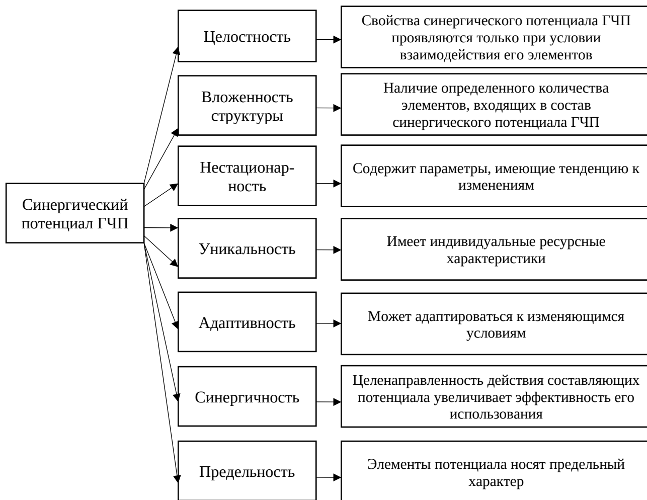
Рисунок 3 – Свойства синергического потенциала партнерского взаимодействия производственных подразделений УИС с представителями бизнес-сообщества при реализации проектов организации труда осужденных

экономических возможностей, уровня развития организационных механизмов управления, возможностей реализации предпринимательской и хозяйственной инициативы, их диалектического взаимодействия. Синергетический потенциал ГЧП имеет сложную структуру, компоненты которой тесно связаны между собой. Поэтому возникает целесообразность исследования этой экономической категории как системы, характеризующейся следующими свойствами (Рисунок 3).