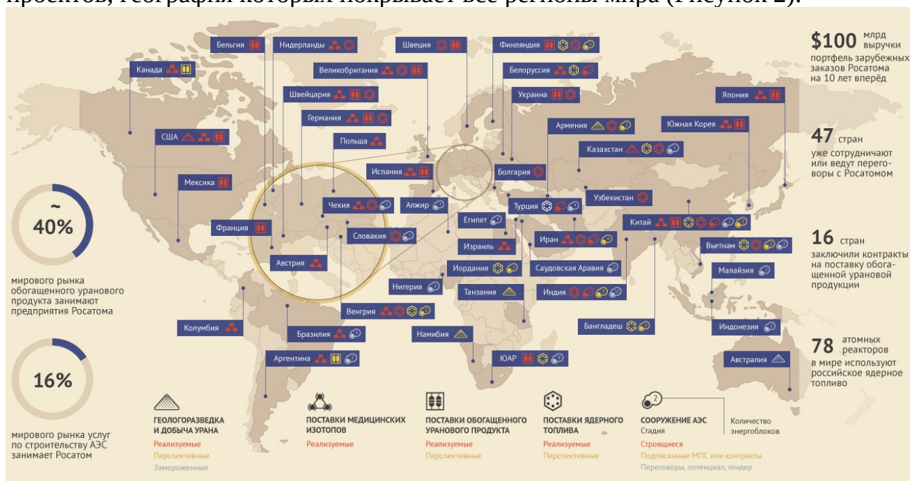
Рисунок 2 – География реализуемых ГК «Росатом» зарубежных проектов

Атомная энергетика является важным элементом обеспечения экономической безопасности, позволяя странам укреплять свою независимость, развивать промышленный потенциал и повышать устойчивость экономики к внешним вызовам. Именно поэтому Росатом является мировым лидером в сфере атомной энергетики и развитии ядерных технологий. Пакет международных контрактов Росатома сформирован из проектов, география которых покрывает все регионы мира (Рисунок 2).