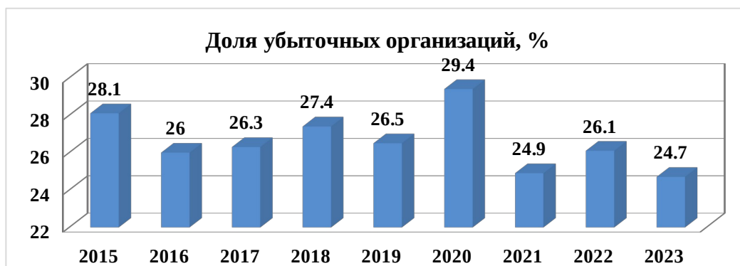
Рис. 2. – Доля убыточных организаций в России за 2015-2023 гг.

При этом отметим, что по данным Федеральной службы государственной статистики доля убыточных организаций в 2023 году снизилась незначительно – на 1,4 процентный пункт по сравнению с 2022 годом, а по сравнению с 2015 годом – на 3,4 процентных пункта [2] (рис. 2).